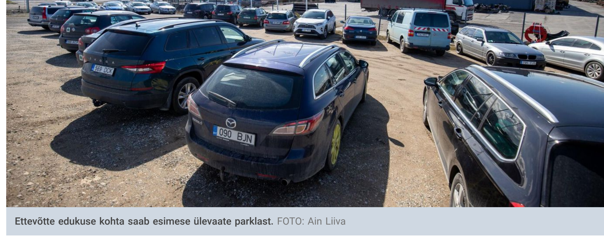
Ettevõtte edukuse kohta saab esimese ülevaate parklast.

Kui kellelgi on "kopp ees", siis on tavaliselt halvasti. Kadriina lähistel Kadapikul on Pomemeti tootmishoonele pidevalt kopad ees, aga neile tähendab see ainult head: ligemale seitsme miljoni eurose aastakäibega ettevõtte, mille põhikaubaks on just nimelt kopad ja sahad, peabki valmistoodangut järjepidevalt uksest välja lükkama, et klientide soovetäita.